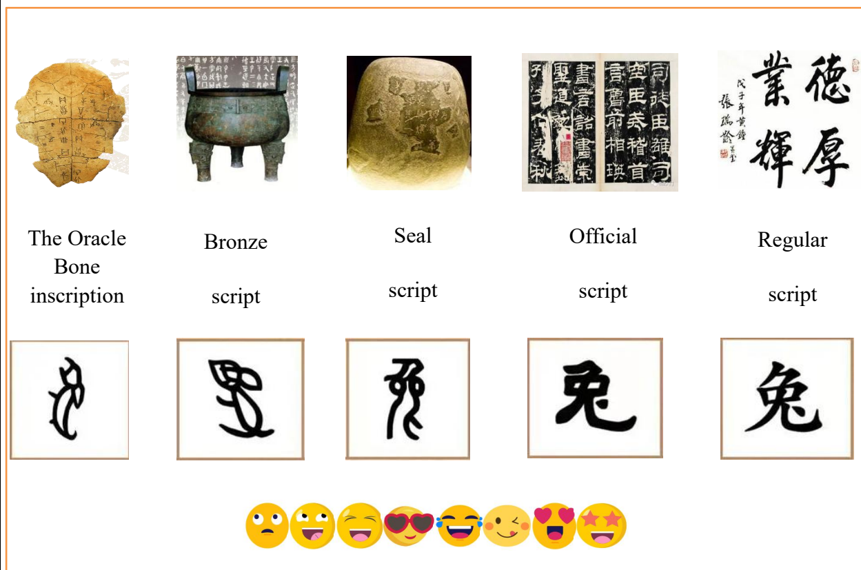
（图2-当表情包遇见甲骨文）