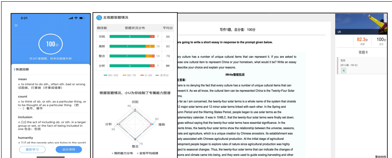
图 5：学生使用 U 校园测评